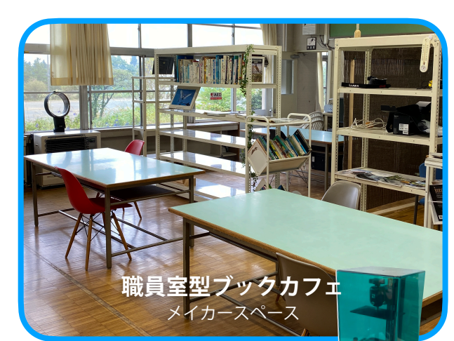
職員室型ブックカフェ メイカースペース

開拓の思い出・開拓地の歴史 観光の思い出・観光地の歴史 そして、家族の思い出など… 捨ててしまう前に デジタル化して残しませんか？