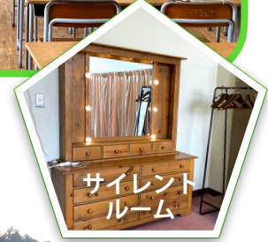
サイレント ルーム